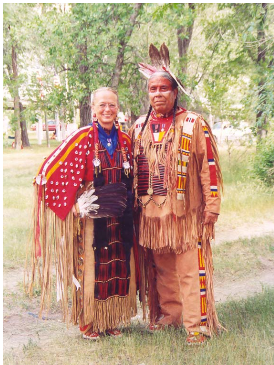
Grow Creek, S.D. USA Juli 2004